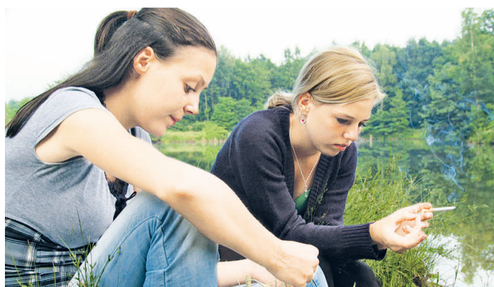
Proti zdi. Hrdinky filmu Nedostupná se marně hlásí ke své matce.